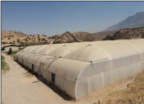
شکل ۲: نمای بیرونی از گلخانه تولید خیار و گوجه فرنگی