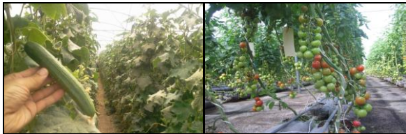
شکل ۱: نمای داخلی از گلخانه تولید خیار و گوجه فرنگی