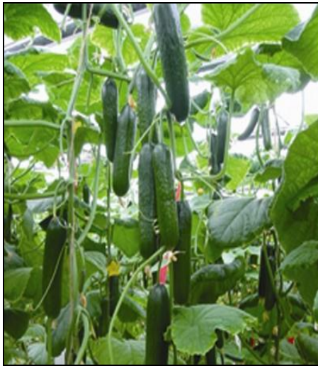
شکل ۴: محصول خیار گلخانه‌ای

اساس شاخص کدهای مقاطع تحصیلی ۵ در واحدهای زیان ده و سودآور به ترتیب حدود ۳/۸ و ۴/۴ بود. این اختلاف از نظر آماری برای گلخانه‌های مورد بررسی کاملا معنی دار است. لذا با توجه به تخصصی و علمی بودن کشت و کار در گلخانه‌ها و اهمیت دانش و آگاهی افراد از علوم و فنون کشت‌های گلخانه‌ای می‌توان نتیجه گرفت که افزایش سطح تحصیلات گلخانه‌داران نقش بسزایی در بهبود مدیریت فنی گلخانه و بالنتیجه سودآوری واحدها در استان کهگیلویه و بویراحمد داشته است.