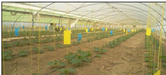
شکل ۳: نمای داخلی از گلخانه تولید خیار

به نظر می‌رسد که روش استفاده از عناصر میکرو در گلخانه‌های استان زیاد مفید نبوده است. زیرا بسیاری از کودهای شیمیایی در خاک تثبیت می‌شوند و بعلت ترکیب شدن با سایر عناصر، عملاً از دسترس گیاه خارج می‌شوند. بنابر این گیاهان گلخانه‌ای استان با وجود اینکه تمامی عناصر میکرو مورد نیاز در خاک را دارند اما بدلیل میزان بالای فسفر قابل جذب و EC و pH بالا، به شدت دچار کمبود عناصر غذایی میکرو هستند. لذا بکارگیری عناصر میکرو با استفاده از روش‌های دیگر توصیه شده توسط کارشناسان خاکشناسی نظیر محلول پاشی ۳ و استفاده از فرم کلات ۴ برای گیاهان گلخانه‌ای استان موثرتر واقع می‌شود.